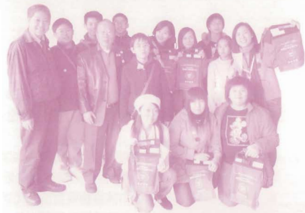
一群熱血的青年義工

當日的天氣雖然很寒冷，氣溫大約只有13、14度左右，各位義工卻憑著一腔熱血，不怕寒風凜冽，仍是滿腔熱誠地在街上售旗，而滿有善心的群眾，亦慷慨捐輸，令善款不斷提昇，在此謹向各位善長人翁致以萬二分感謝。